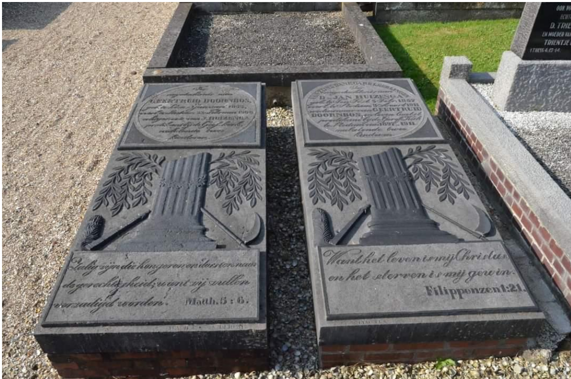
Foto: Menne Tillema, 2016 voor Open Monumentendag; thema: Iconen en symbolen.

Artikel ook geplaatst in 'De Stedumer' van september 2024 en op onze facebook-pagina https://www.facebook.com/StichtingHistorieStedum